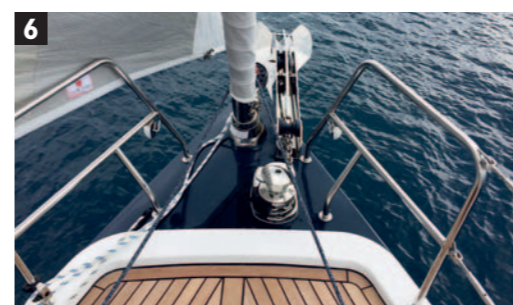
6. L'accesso alla cala dell'ancora non è dal ponte, ma dalla cala delle vele. 7. Il cielo della tuga si trasforma in prendisole ed è costellato di passauomo a filo. 8. Larghi passavanti consentono passaggi agevoli anche a barca sbandata.