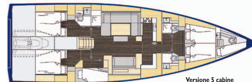
Versione 5 cabine